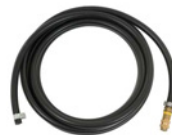
Shielding gas hose 4.5 m