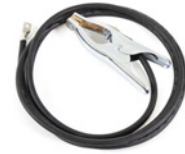
Earth return cable 25 mm 2 , 3 m

Le MST 400 est une unité de transport à deux roues recommandée pour les bouteilles de gaz de petites tailles.