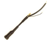
Euro Adapter for MinarcMig

L'adaptateur Euro pour MinarcMig vous offre un tout autre niveau de connectivité.