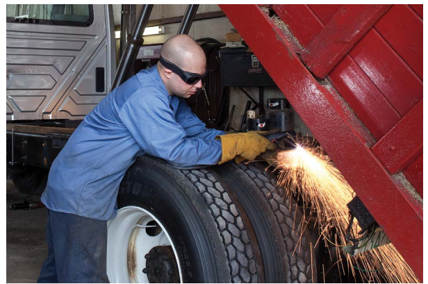
Fahrzeugreparatur und -umbau