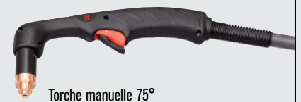
Torche manuelle 75°

(pour plus d'options de torche, consulter www.hypertherm.com )