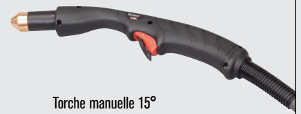
Torche manuelle 15°