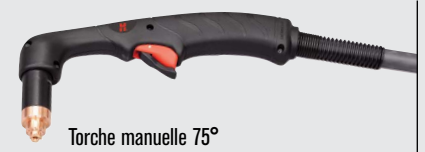
Torche manuelle 75°

(pour plus d'options de torche, consulter www.hypertherm.com )