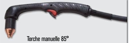
Torche manuelle 85°

Styles de torches standards Duramax® Hyamp™ (pour plus d'options de torche, consulter www.hypertherm.com )