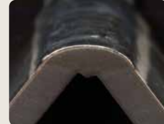
Ein stabiler Lichtbogen sorgt für eine gleichförmige Schweißnaht und ein festes Aneinanderfügen der geschweißten Teile, wodurch wiederum gute mechanische Eigenschaften der Schweißverbindung gewährleistet wird.

Ein größerer Anteil an Wechselstrom führt zu einem besseren Reinigungseffekt, während ein höherer Gleichstrom einen besseren Einbrand gewährleistet.