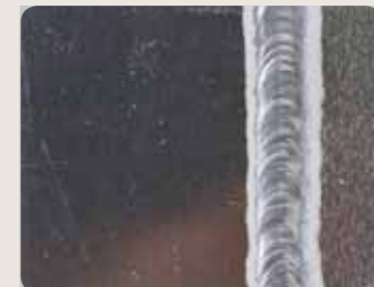
Mit Hilfe der Funktion MIX TIG können die guten Qualitäten von Gleich- und Wechselstrom kombiniert werden. Sie erleichtert das Verschweißen von Aluminiummaterialien und gewährleistet eine Minimierung der Anzahl von Verformungen.