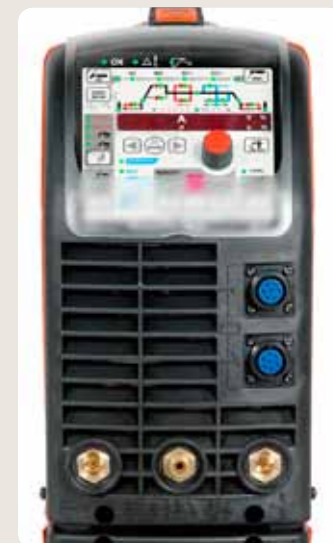
Alle Schweißgeräte der Reihe „MasterTig MLS ACDC“ können mit einem ACX- oder ACS-Bedienpanel ausgestattet werden, an denen zahlreiche nützliche Funktionen für eine angenehmere und effizientere Schweißarbeit ausgeführt werden können.

ACS: Grundfunktionen und MIX TIG ACX: Grundfunktionen, MIX TIG, Speicherkanäle und Sonderfunktionen wie MicroTack, Impulsschweißen, Minilog, 4T LOG