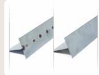
Der Unterschied in den Heftnähten ist deutlich erkennbar. An dem rechten Teil wurden die Heftschweißungen mit Hilfe der Funktion MicroTack durchgeführt, während das linke Teil mit dem normalen WIG-Schweißverfahren heftgeschweißt wurde.

Der Wärmeeintrag ist beim Schweißen mit der Funktion MicroTack äußerst gering, wodurch für den Anwender die Möglichkeit besteht, ordentliche und unauffällige Heftnähte ohne Verzug herzustellen. Dies ermöglicht wiederum einen schnelleren Ablauf der darauf folgenden Arbeitsvorgänge, was schließlich auf eine höhere Produktivität der gesamten Schweißarbeit hinausläuft.