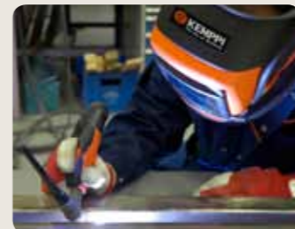
Schweißen mit der Funktion MicroTack führt auf einfache und schnelle Weise zu einer besseren Qualität und Produktivität der Schweißarbeit.